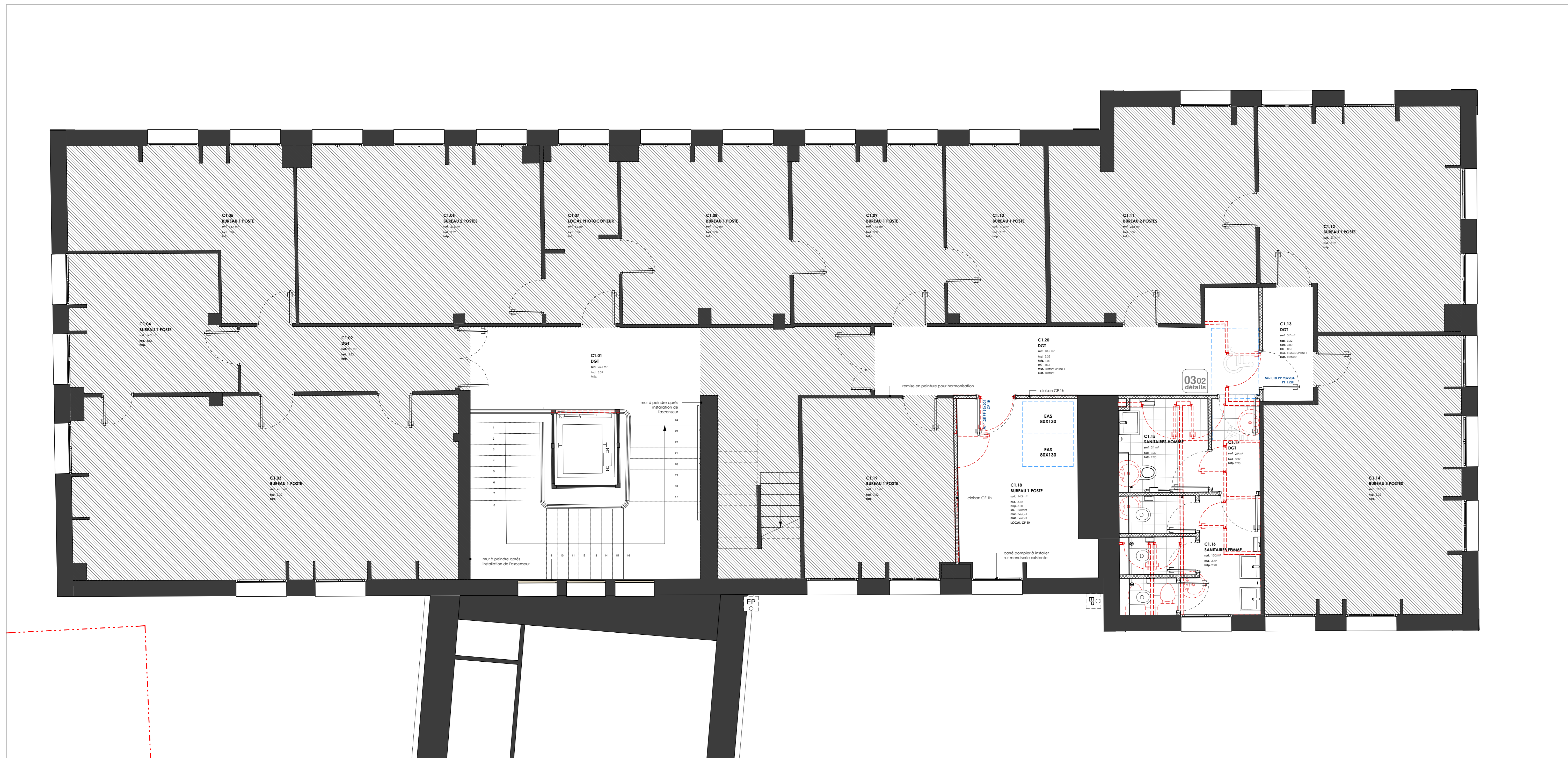
DEMOLITION ET PROJET - BATIMENT C - NIVEAU 1